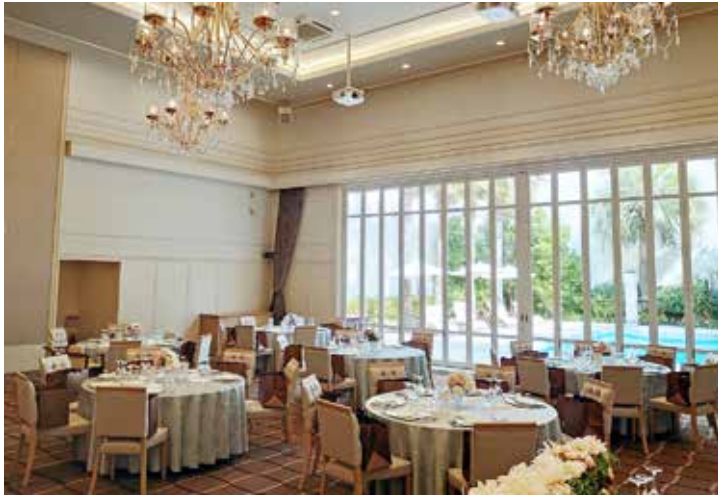
◀ プールヴィラ・パーティ会場 ▼ プールヴィラ・ガーデン

エルフラットグループ最大の大型会場。 大小2つのテイストの異なる会場は それぞれプール付きで まるで海外リゾートを訪れたかのような空間。