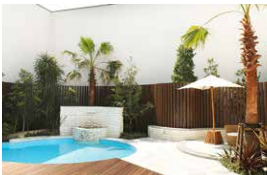
▲ ガーデンヴィラ・ガーデン ガーデンヴィラ・パーティ会場 ▶