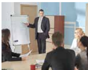
特別講師を招いた講習会