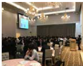
スクリーンを使ったセミナー